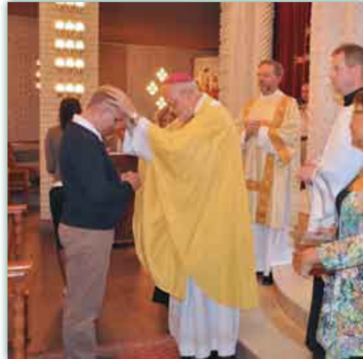
Biskop Anders Arborelius välsignar en kateket under mässan på Kateketens dag i Stockholm, 3 september 2011.

Kära kateketer! Guds människoblivande är kärnan i vår tro och i vårt julfirande. Det är min bön och önskan för er att detta mysterium alltid fyller er med glädje över Guds närhet i Jesus Kristus. Han vill stödja och hjälpa er i allt, så att ni kan förmedla det hopp som tänts på jorden när Gud blev en av oss.