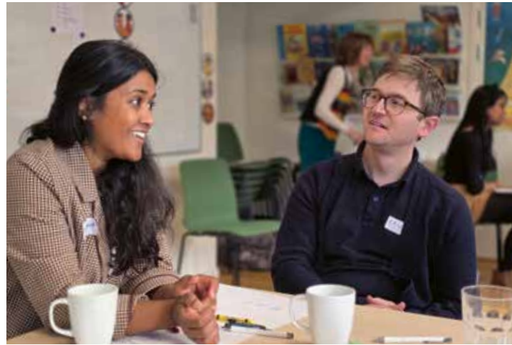
Kateketer på kateketutbildning, hösten 2025.