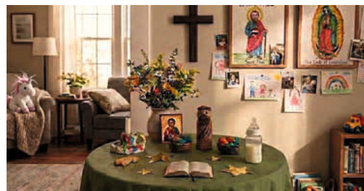
Solveig Fenet-Chantereau har skapat "Hemkyrkans veckoblad". En hemsida med tips och idéer för familjens vardagsliv med Gud.